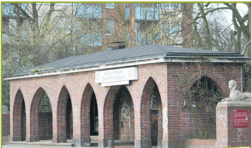
Das Torhaus macht beim Blick von der Straße einen guten Eindruck

„Im Bezirk bewegt sich seit geraumer Zeit in dieser Sache nichts mehr“, bedauert Dr.