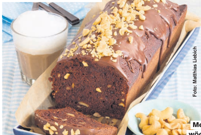
Mehr Rezepte wöchentlich in:

1 Schlagsahne in eine Rührschüssel füllen und kalt stellen. Becher auswaschen, abtrocknen und zum Abmessen der anderen Zutaten verwenden. Cashew-Kerne grob hacken. Schlagsahne nicht ganz steif schlagen. Zucker, Eier und Öl unterrühren. Kakaopulver unterrühren.