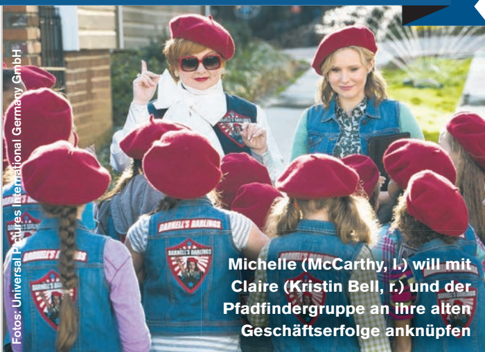
Michelle (McCarthy, l.) will mit Claire (Kristin Bell, r.) und der Pfadfindergruppe an ihre alten Geschäftserfolge anknüpfen