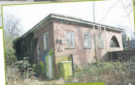
Hinter den Kulissen ist der schlechte Zustand des Gebäudes von 1927 unübersehbar