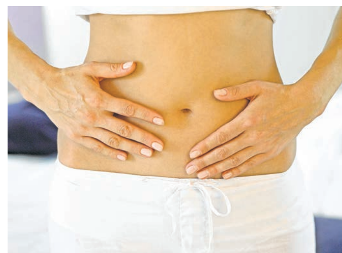
Milchsäurebakterien können bei Verdauungsproblemen helfen

Nach Ansicht der Gesundheitsexperten des Verbraucherportals Ratgeberzentrale.de können diese „guten“ Bakterien den Stoffwechsel positiv beeinflussen, indem gesundheitsschädliche Produkte im Darm absorbiert und verstoffwechselt werden. Darüber hinaus können Milchsäurebakterien das Wachstum der natürlichen Darmbakterien