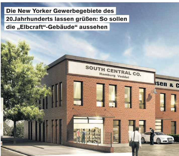
Die New Yorker Gewerbegebiete des 20. Jahrhunderts lassen grüßen: So sollen die „Elbcraft“-Gebäude aussehen

Und genau dort, an der Peutestraße, entstehen jetzt auf einem 2.000 Quadratmeter großen Grundstück sechs Gewerbelofts in Backsteinarchitektur, die wie Reihenhäuser konzipiert sind und jeweils eine flexible Fläche von 150 bis 250 Quadratmeter bieten. Die ebenerdigen Rolllotre sorgen dabei für bequeme Lademöglichkeiten ohne Rampe. Der erste Stock ist gekennzeichnet von großen Fenstern, durch die das Licht flutet. Hallen- und Bürofläche bilden dabei jeweils eine Einheit, die der Mieter ganz nach seinen Bedürfnissen ausstatten kann. Wer dort Quartier bezieht, ist schon von weitem sichtbar: Dafür sorgt auch der großflächige Firmenname, der oberhalb der Fenster