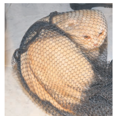
Im Netz aus der Notlage befreit: „Mister Cat“

EILBEK Es war auf einem Dach in Eilbek, auf dem der vierjährige „Mister Cat“ (so sein wirklicher Namen) mit seinem Ausflug für einen vierstündigen Einsatz der Feuerwehr gesorgt hat. „Mister Cat“ war von der Dachterrasse auf das danebenliegende Dach gelaufen und wollte sich einen alten Lichtschacht ansehen. Und dabei passierte es. „Mister Cat“ zwangte sich durch eine kleine Lücke, verlor das Gleichgewicht und stürzte in einen alten stillgelegten und mit Glas überdachten Schacht und blieb dort geschockt, aber unverletzt liegen. Die Feuerwehr wurde gerufen. Der Einsatz mehrerer Höhenretter war nötig. Erst nach zahlreichen Versuchen mit diversen Ausrüstungsgegenständen und sehr viel Improvisation glückte es, das Tier unverletzt zu befreien. Als Hilfsmittel wurden Stangen, Kabelbinder, Klebeband, Klappspaten, Netze, Schaufeln und weitere technische Feinheiten eingesetzt. Nach seiner Rettung bekam „Mister Cat“ erst einmal ein paar Schmusseinheiten. (wb)