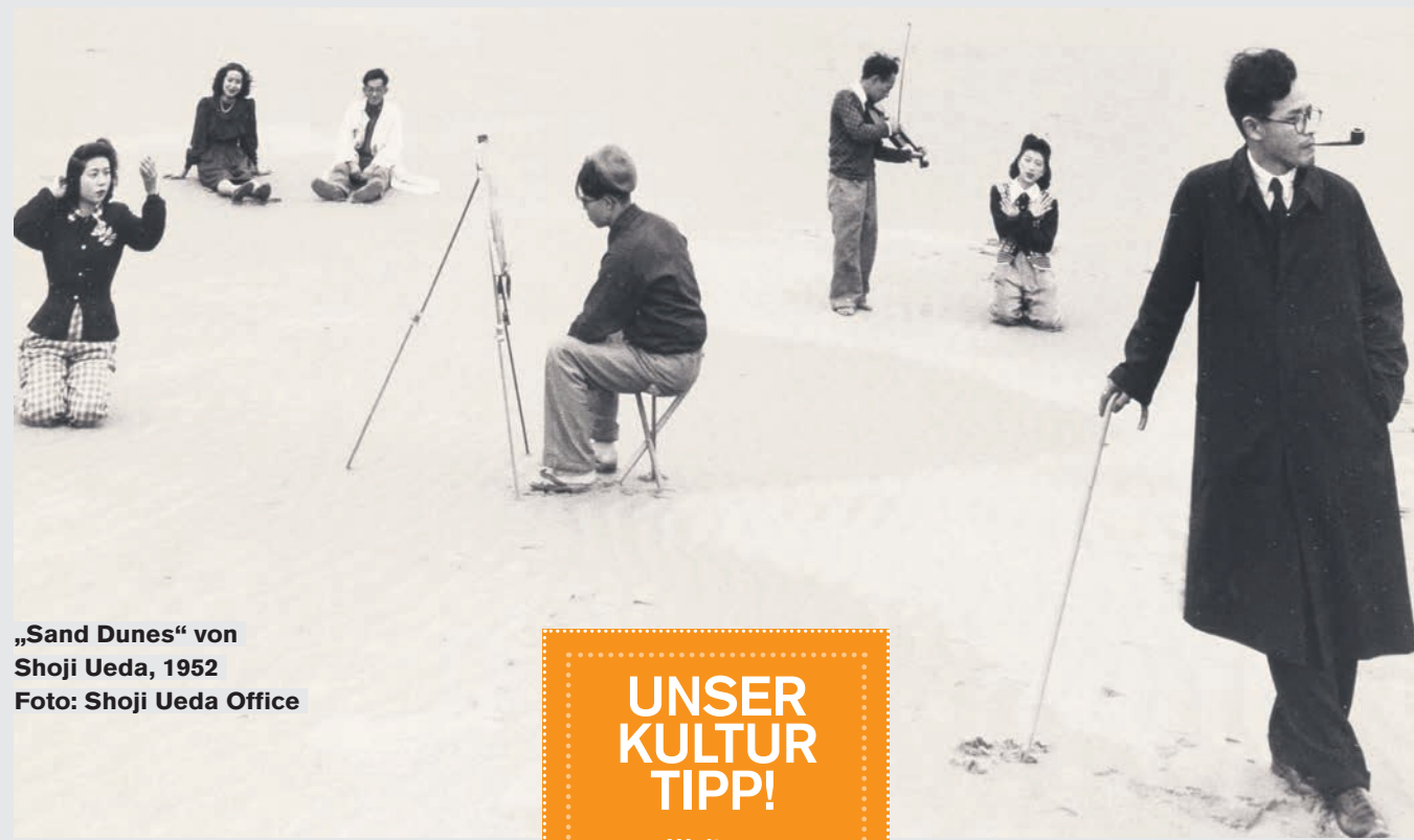
„Sand Dunes“ von Shoji Ueda, 1952

Fotoausstellung im Museum für Kunst und Gewerbe