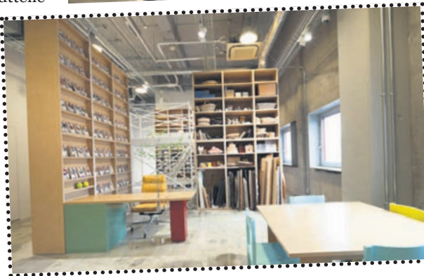
Jeder Mieter kann und soll seine Räume nach eigenen Wünschen einrichten können. Grafi-ken: elbcraft

prangen wird. Ein Baustil mit New Yorker Flair, für den der Bedarf offenbar vorhanden ist. Im November soll das Projekt fertig gestellt sein – und es gibt bereits